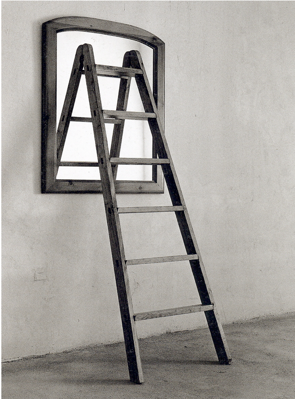
TXEMA MADDOZ, Izenbururik gabe / Sin título, 1990