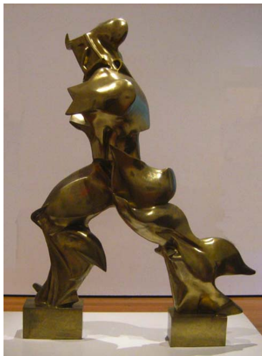
Boccioni. Espazioko jarraitutasunaren forma bakarra / Forma única de continuidad espacial.