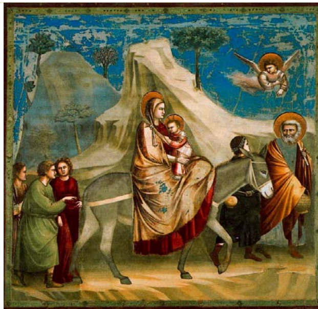
Giotto. Scrovegni kaperako freskoak: Ihesa Egiptora / Frescos de la capilla Scrovegni: Huida a Egipto

Analiza estas 2 imágenes: (2,5 puntos cada una)