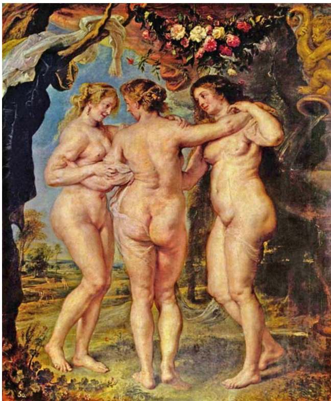
Peter Paul Rubens: Hiru graziak / Las tres Gracias

Analiza estas 2 imágenes: (2,5 puntos cada una)