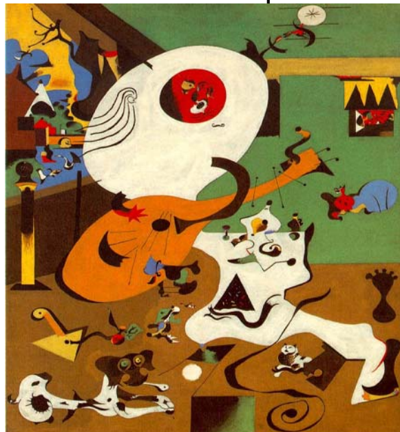
Joan Miró. Barneko holandarra / Interior holandés