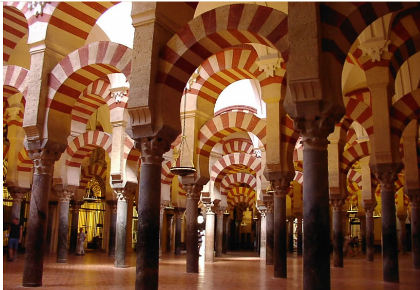
Kordobako meskita / La mézquita de Córdoba