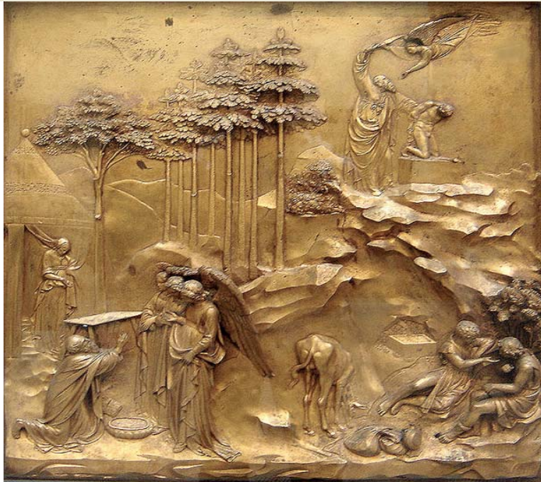
Lorenzo Ghiberti . Florentziako Katedraleko Bataiotegiko atea / Puertas del Baptisterio de la Catedral de Florencia.