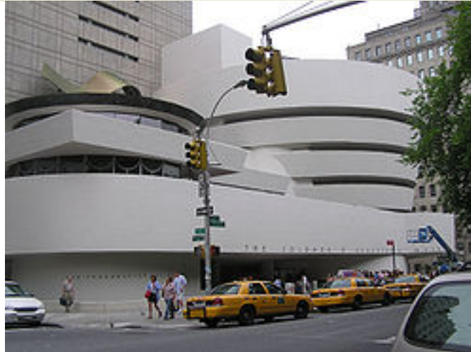
Frank Lloyd Wright: Guggenheim Museum. New York

Analiza estas 2 imágenes (2,5 puntos cada una)