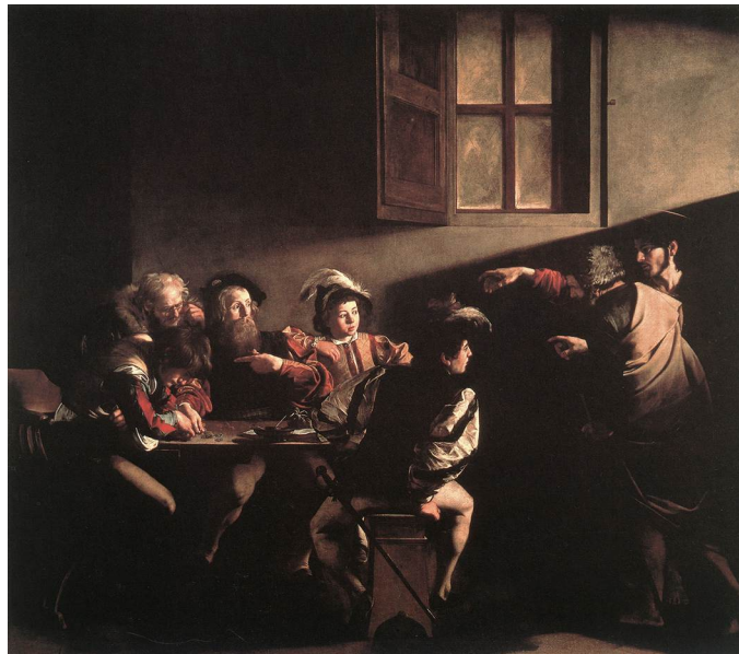
Michelangelo Merisi da Caravaggio: San Mateoren bokazioa./ La vocación de San Mateo