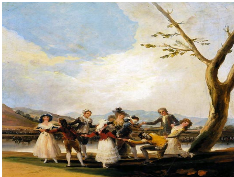
Francisco de Goya: Isumandoka / La gallina ciega.