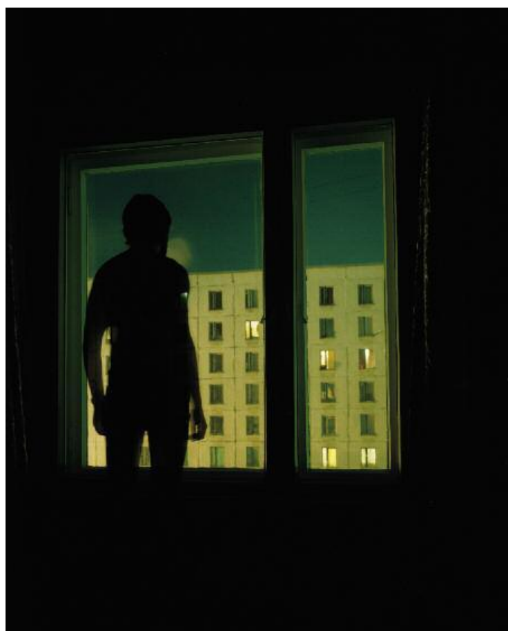
ALEXANDER GRONSKY, Endless Night , Murmansk, Russia, 2007