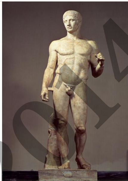
Poliklito Argoskoa: "Doriforoa" / Policleto de Argos: "El Doríforo"

Analiza estas 2 imágenes (2,5 puntos cada una).