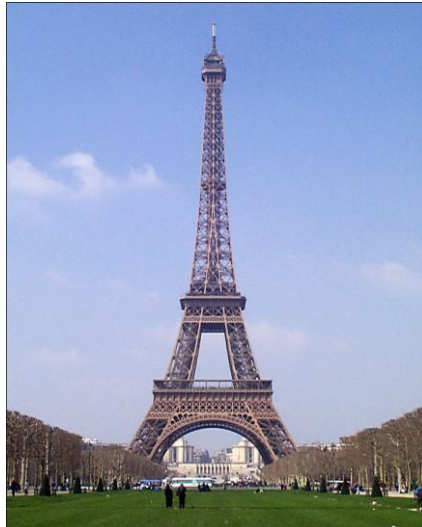
Eiffel dorrea (Paris) / Torre Eiffel (París)