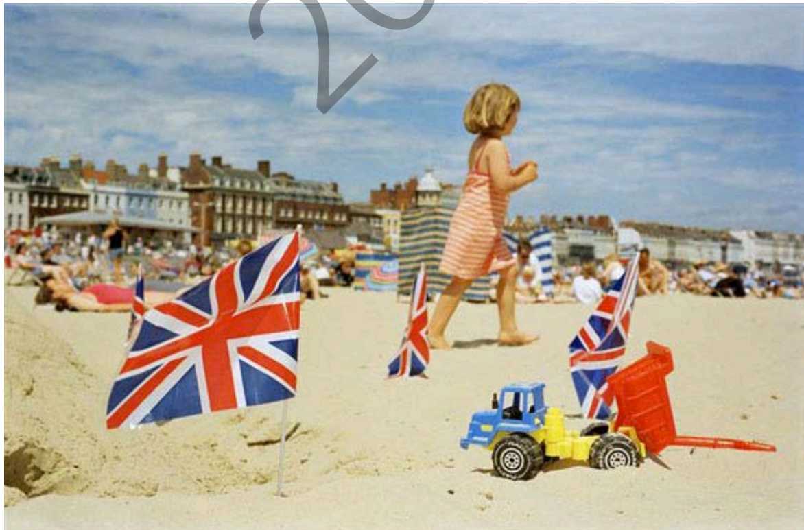
MARTIN PARR , Weymouth, England, GB, 1998. from Life's A Beach