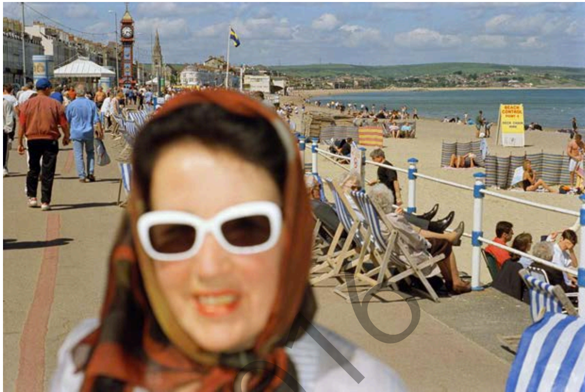
MARTIN PARR , Weymouth, England, GB, 2000. from Life's A Beach