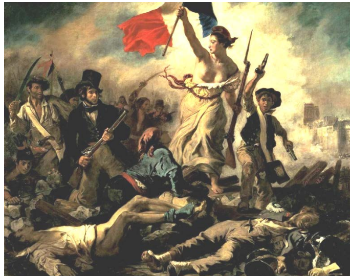
Askatasuna herria gidatzen. Delacroix. La libertad guiando al pueblo.