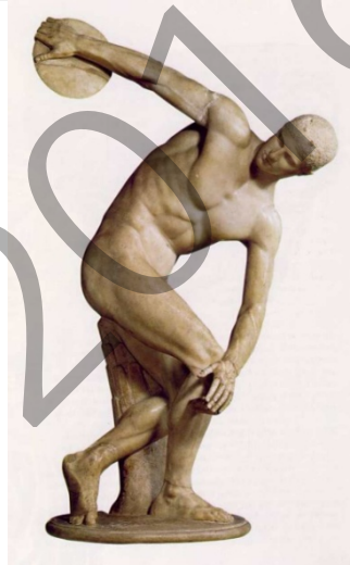
Diskoboloa. Miron / Mirón. El discóbolo.