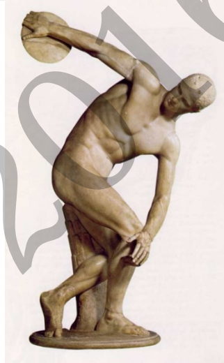
Diskoboloa. Miron / Mirón. El discóbolo.