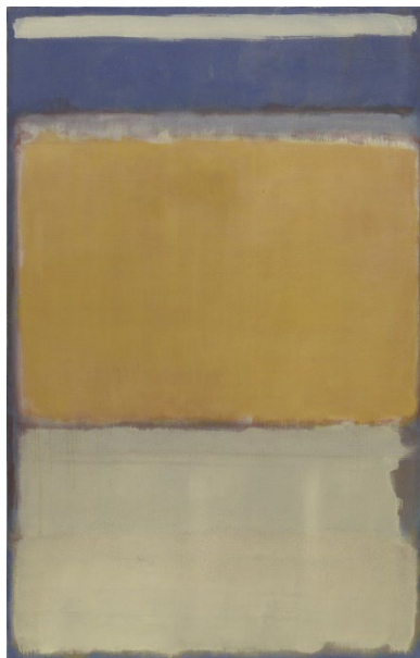
Mark ROTHKO: No. 10 (1950)