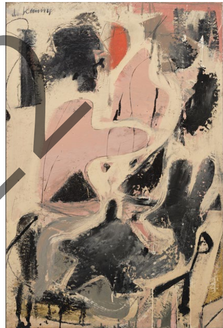
Willem DE KOONING: Valentina (1947)