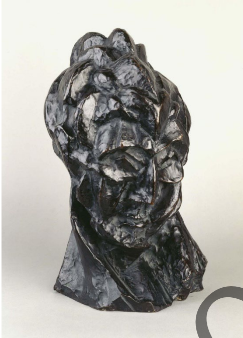
Pablo PICASSO: Cabeza de Fernande Olivier (1909)