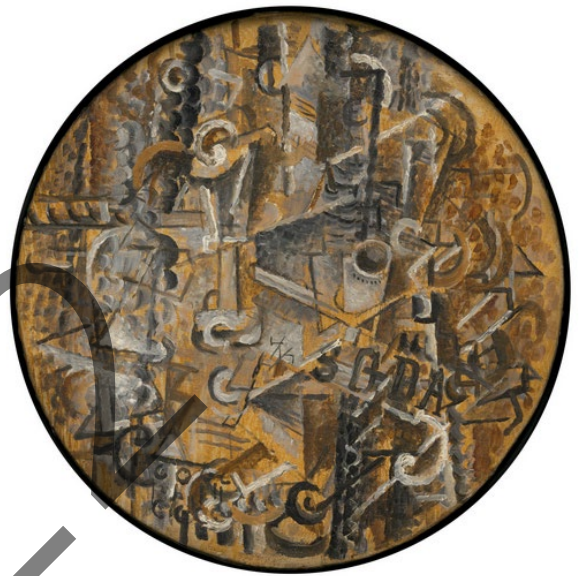
Georges BRAQUE: Soda (1912)