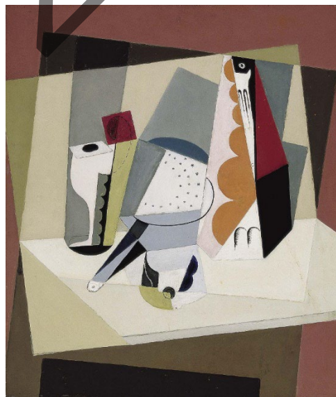
María BLANCHARD: Naturaleza muerta cubista (c.1917)