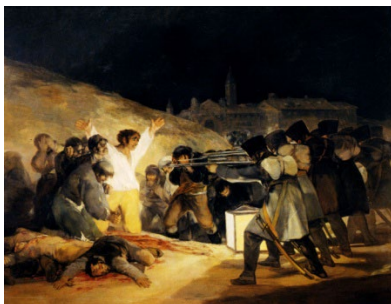
Francisco de Goya Los fusilamientos del 3 de Mayo/ Maiatzaren hiruko fusilamenduak