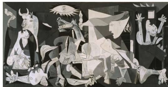
Pablo Picasso Gernika