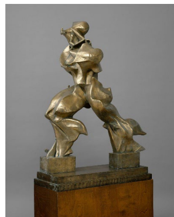
Umberto Boccioni Formas únicas de continuidad en el espacio Jarraitutasunaren forma bakarrak espazioan