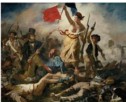
Eugène Delacroix La libertad guiando al pueblo Askatasuna herriaren gidari