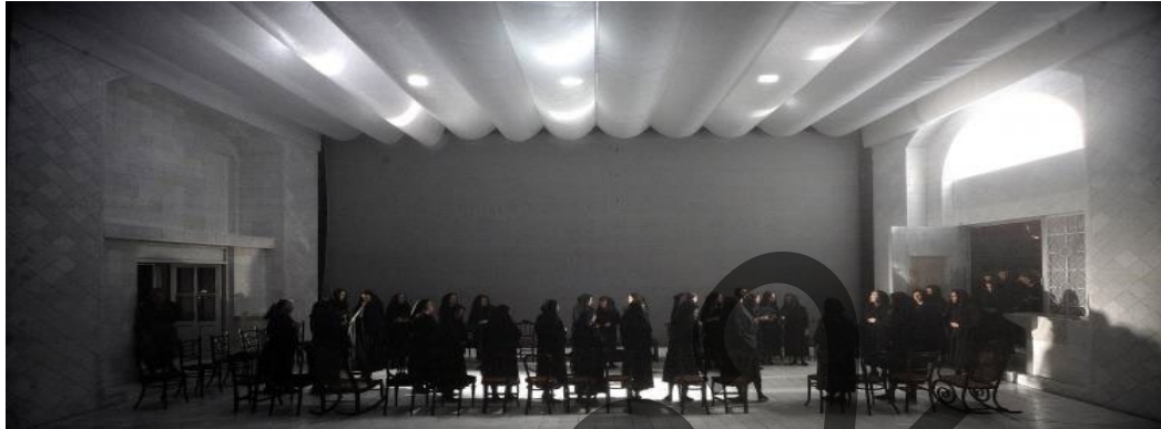
Fotografía (David Ruano): https://www.tnc.cat/es/la-casa-de-bernarda-alba

https://elpais.com/diario/2009/05/09/babelia/1241823974_850215.html