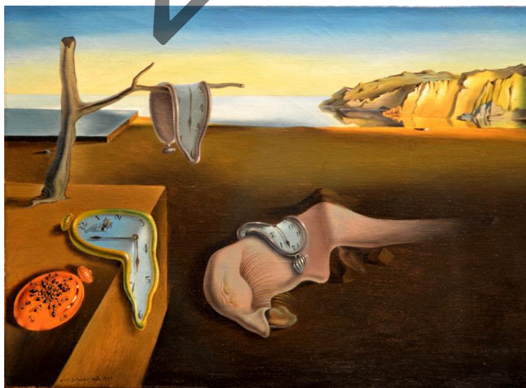
DALÍ: La persistencia de la memoria (1931)