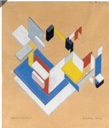
VAN DOESBURG: Composición espaciotemporal II (1924)