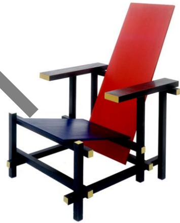
RIETVELD: Silla roja y azul (1917)