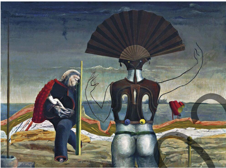
ERNST: Hombre viejo, mujer y flor (1923-1924)

Propuesta de tema B: Explica el desarrollo del surrealismo.