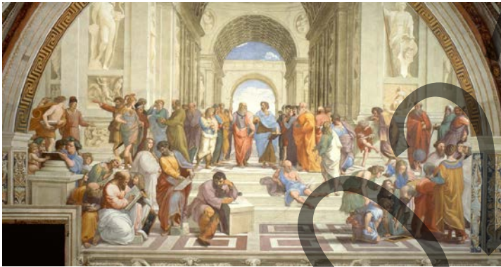
Rafael La Escuela de Atenas / Atenasko Eskola

Egin irudi hauetako Biren iruzkina (2,5 puntu bakoitzak): Analiza DOS de estas imágenes (2,5 puntos cada una):