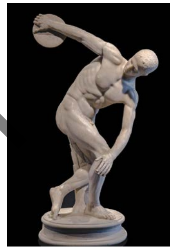
Mirón / Miron El Discóbolo / Diskoboloa