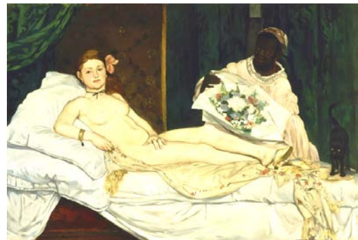
Edouard Manet Olympia