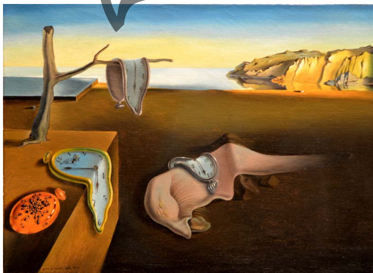
DALI: Oroimenaren iraunkortasuna (1931)