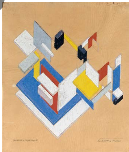
VAN DOESBURG: Konposizio espazio-tenporala II (1924)