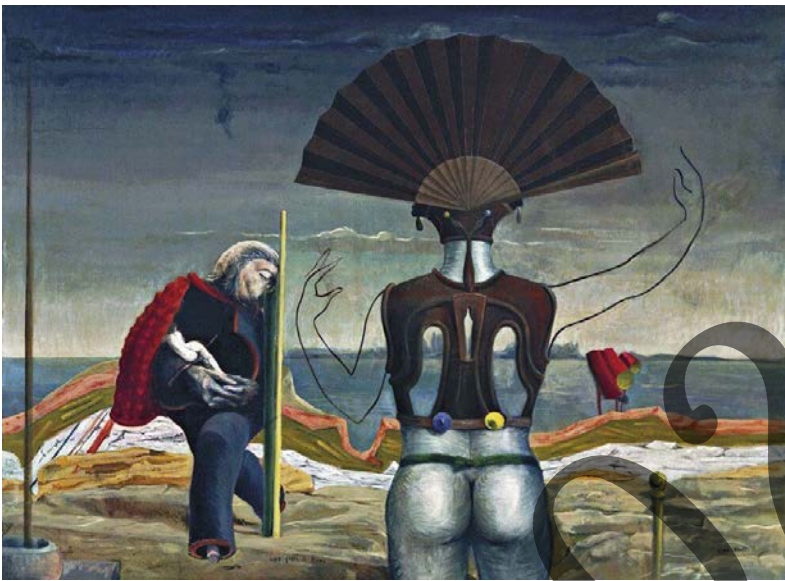
ERNST: Gizon zaharra, emakumea eta lorea (1923-1924)