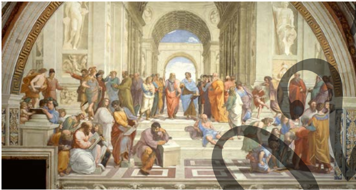
Rafael La Escuela de Atenas / Atenasko Eskola

Egin irudi hauetako Biren iruzkina (2,5 puntu bakoitzak): Analiza DOS de estas imágenes (2,5 puntos cada una):