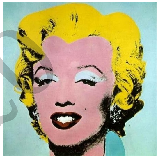
WARHOL: Marilyn (1964)