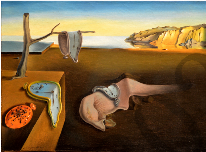
DALÍ: Memoriaren iraunkortasuna (1931)

Gai-proposamena: Esplikatu zertan zetzan surrealismoa eta zein izan ziren haren artista garrantzitsuenak.