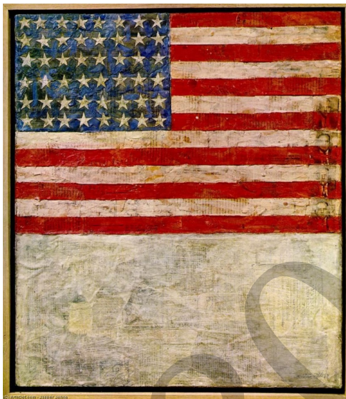
JOHNS: Amerikar bandera zuriaren gainean (1954)

Gai-proposamena: Esplikatu pop artearen garapena.