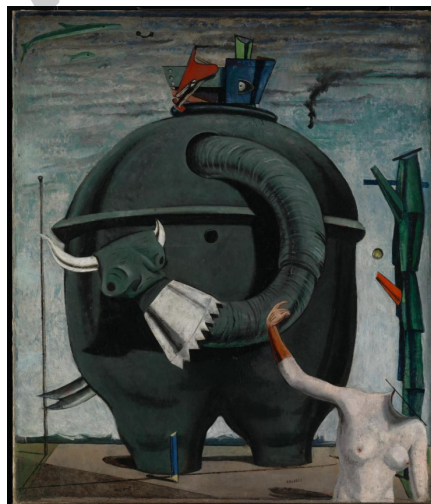
ERNST: Zebeetako elefantea (1921)