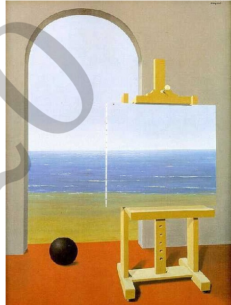
MAGRITTE: Giza egoera (1935)