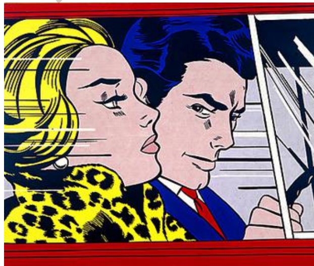
LICHTENSTEIN: Automobilean (1963)