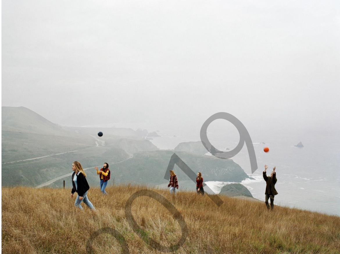
Justine Kurland One Red, One Blue 2001