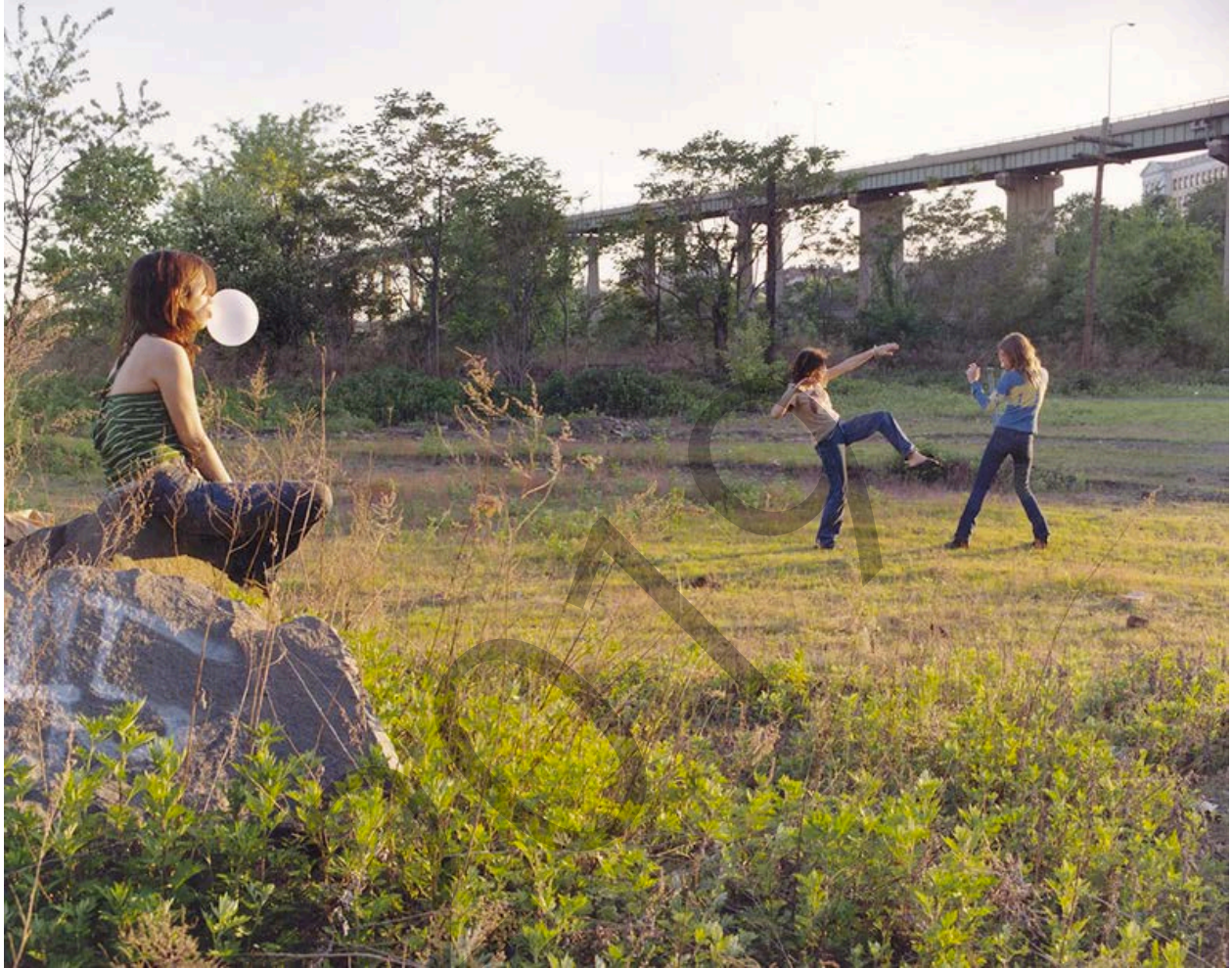
Justine Kurland. Kung Fu Fighters 19

IKUS-ENTZUNEZKO KULTURA II CULTURA AUDIOVISUAL II