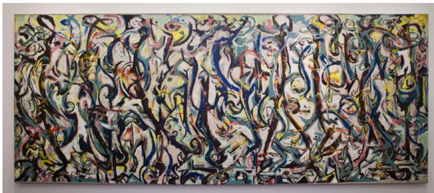
Peggy Guggenheimentzako Murala, Jackson Pollock, Mural para Peggy Guggenheim