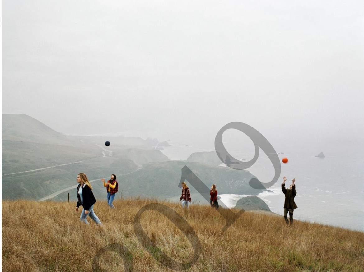
Justine Kurland One Red, One Blue 2001