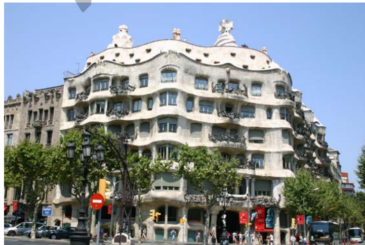
GAUDI: Bartzelonako Milà etxea (1906-1910)