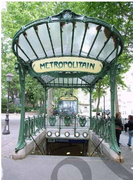
GUIMARD: Parisko metro-geltoki bat (1900)

Gai-proposamena: azaldu ezazu modernismoaren garapena.