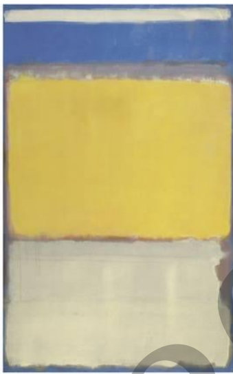
ROTHKO: 10. zenbakia (1950)

Gai-proposamena: azaldu ezazu espresionismo abstraktu amerikarra.