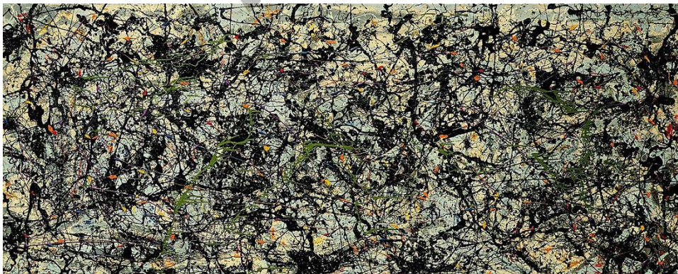
POLLOCK: Luzifer (1947)