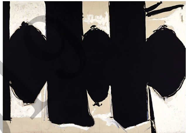
MOTHERWELL: Elegia Espainiar Errepublikari (1957-1961)