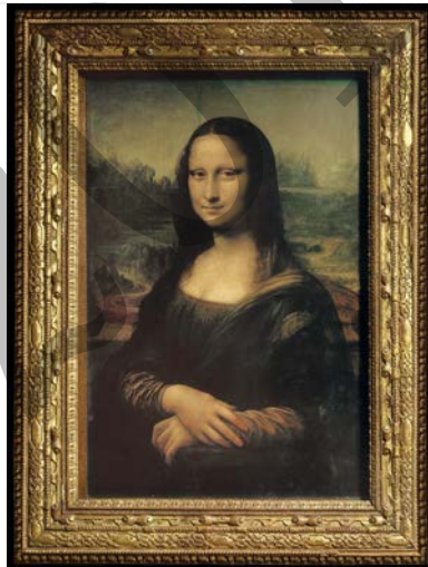
Leonardo da Vinci, La Gioconda

Analiza estas dos imágenes: (2,5 puntos cada una)