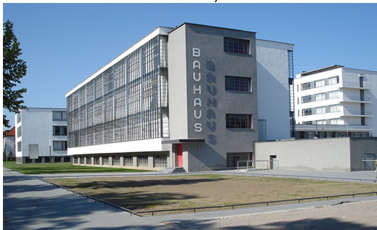
Martin Gropius, Bauhaus, Dessau