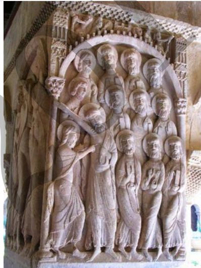
San Tomasen Zalantza, Silosko klaustroko erliebea Duda de Santo Tomás, relieve del Claustro de Silos

Analiza estas dos imágenes: (2,5 puntos cada una)