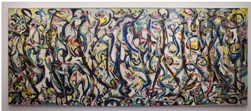
Peggy Guggenheimtzako Murala, Jackson Pollock, Mural para Peggy Guggenheim