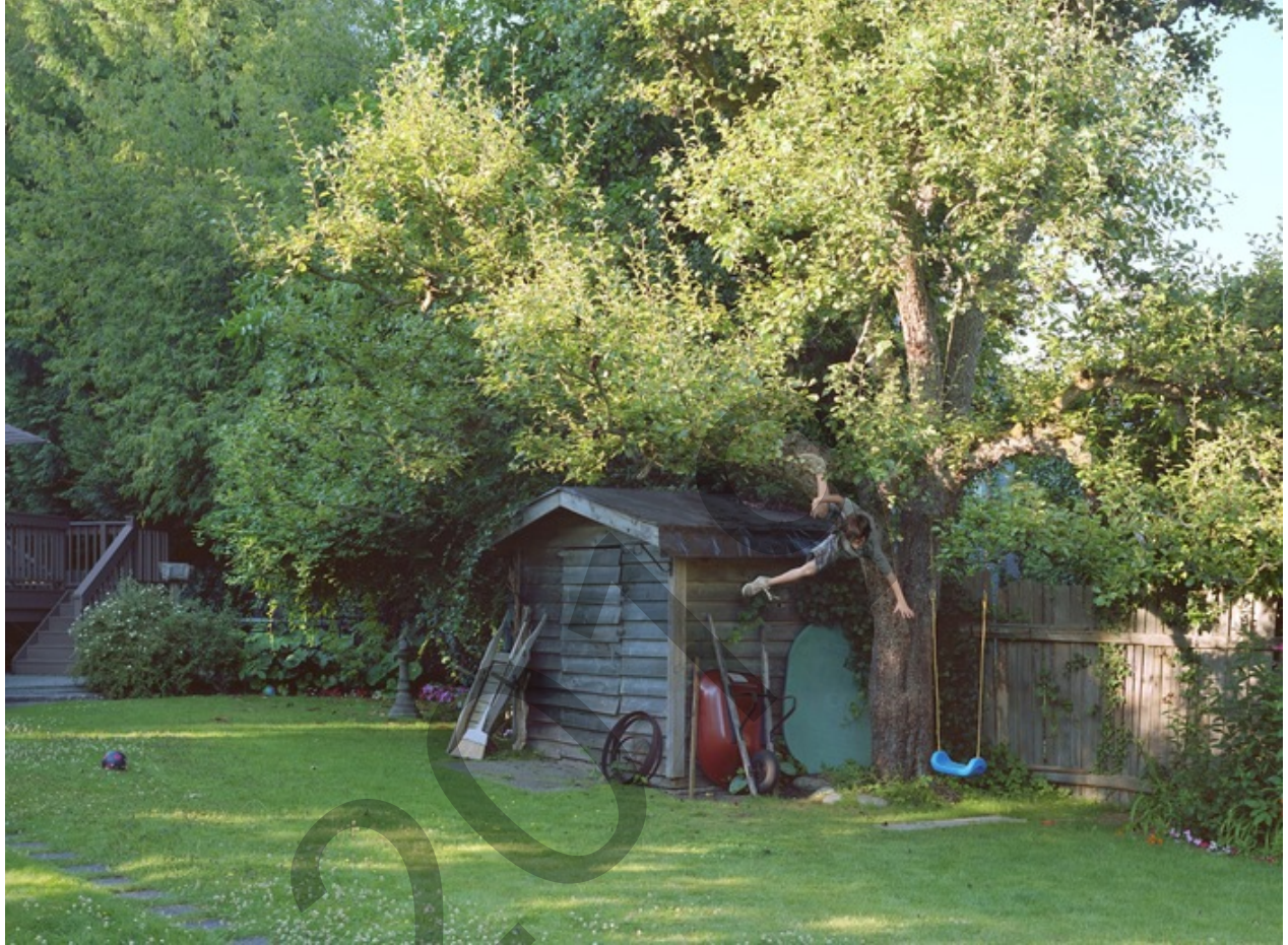
'Boy falls from tree', Jeff Wall 2010