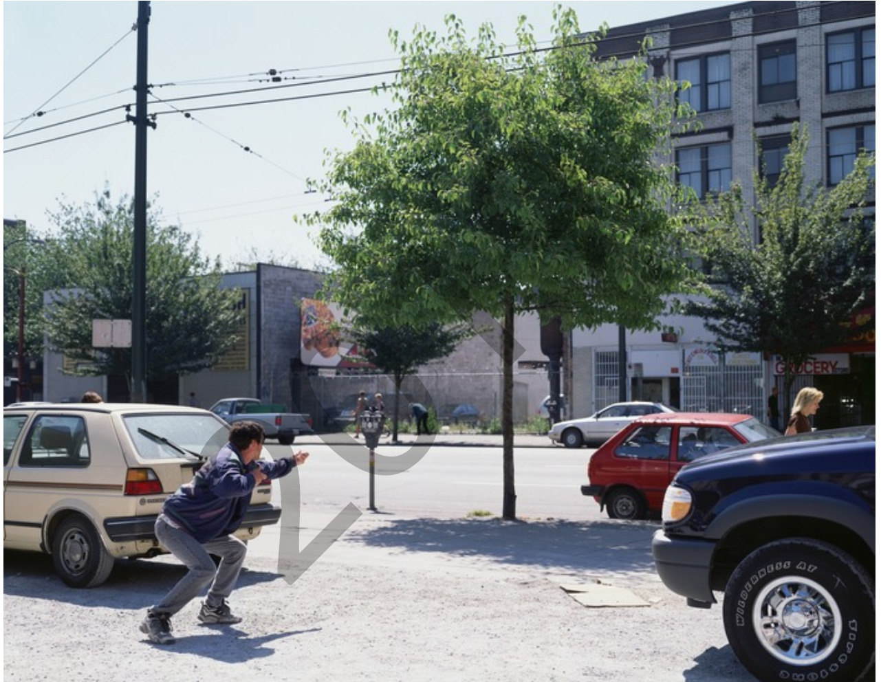
“A Man With a Rifle” Jeff Wall 2000