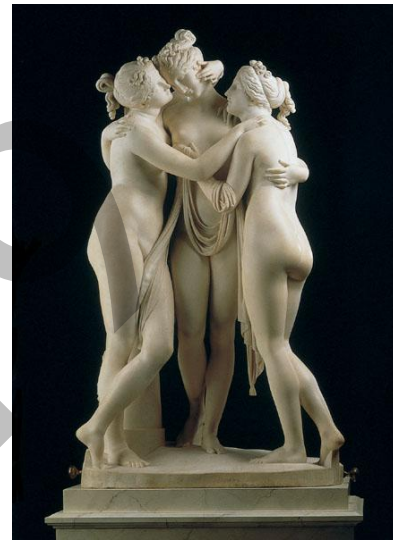
CANOVA: Las Tres Gracias (1816)