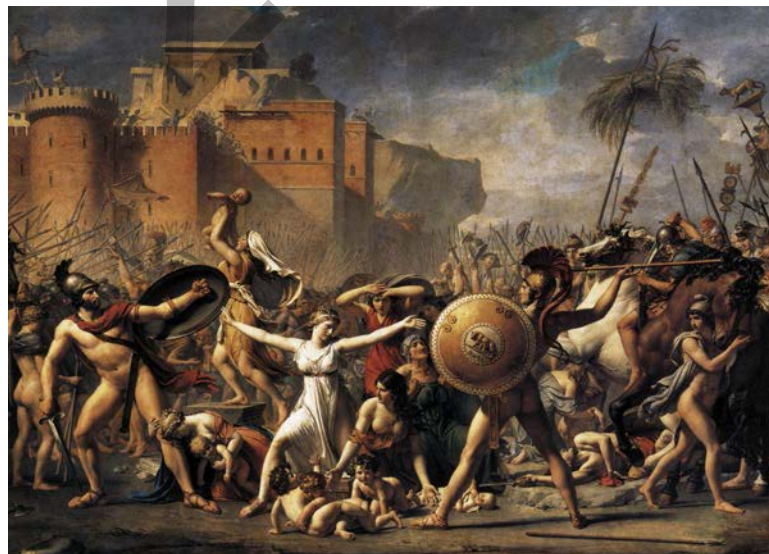
DAVID: El rapto de las Sabinas (1799)