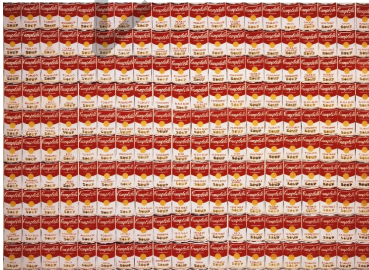
WARHOL: 200 latas de sopa Campbell (1962)