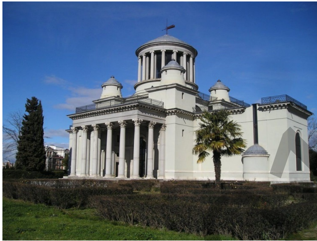
VILLANUEVA: Observatorio Astronómico de Madrid (1785)

Propuesta de tema: Explica el desarrollo del neoclasicismo.