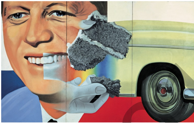
ROSENQUIST: Presidente electo (1960-1961)

Propuesta de tema: Explica el desarrollo del arte pop.