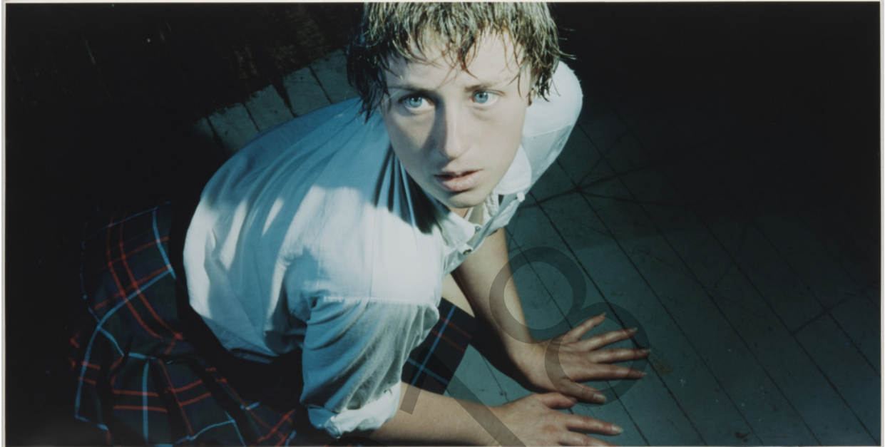
Cindy Sherman. Titulurik gabe / Sin título; 95 zk. Centerfolds. 1981