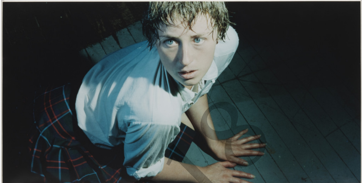
Cindy Sherman. Titulurik gabe / Sin título; 95 zk. Centerfolds. 1981