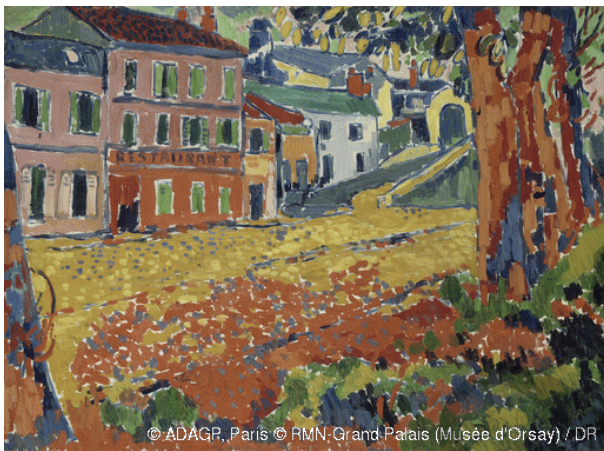
VLAMINCK: "La Machine" jatetxea Bougivalen (1905 i.)

Gai-proposamena: Azaldu fauvismoaren garapena.