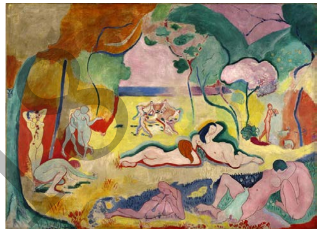
MATISSE: Bizipoza (1905-1906)