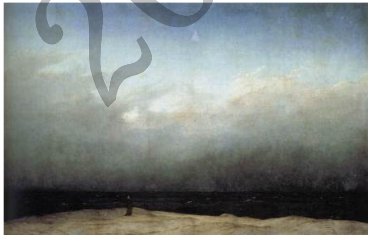
FRIEDRICH: Monjea itsasoaren aurrean (1809)

3. GALDERA (proba-idatziaren % 20 balio du): Jarraian, testu zati bat proposatzen da. Irakur ezazu, laburbildu haren ideia nagusiak, eta