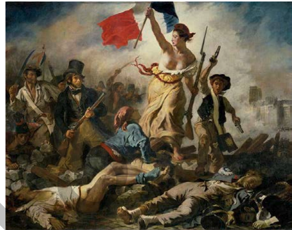
DELACROIX: Uztailaren 28a: Askatasuna herriaren gidari (1830)