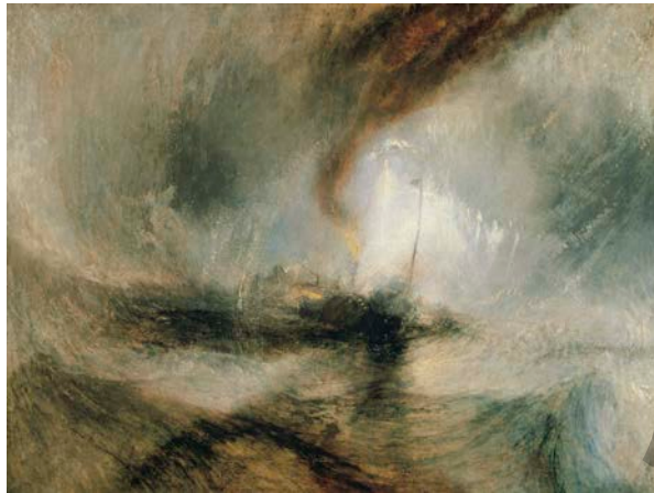
TURNER: Elur- eta lurren-ekaitza portu baten sarreran (1844)

Gaia: azaldu ezazu erromantizismoaren garapena.