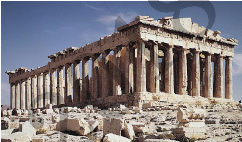
Atenasko Partenoia / Partenón de Atenas

Analiza estas 2 imágenes: (2,5 puntos cada una)