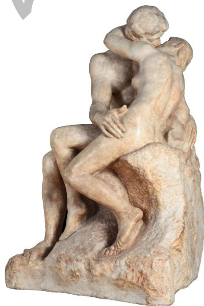
Musua. Auguste Rodin. El beso