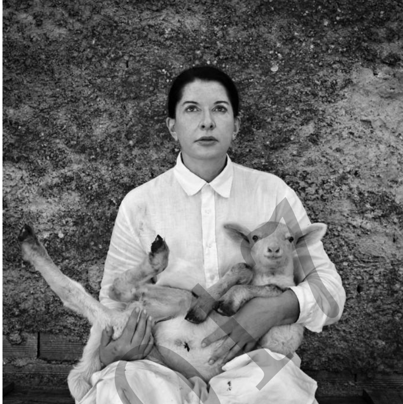
Self-portrait with white lamb. Marina Abramovic 2010