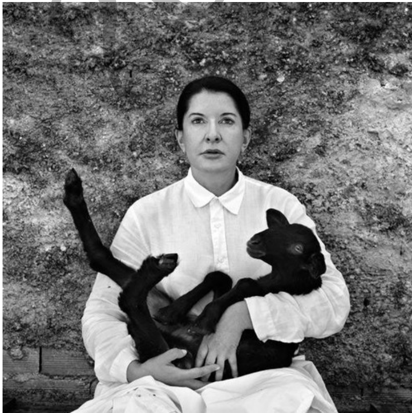
Self-portrait with black lamb. Marina Abramovic 2010