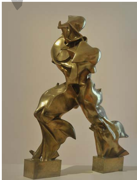
Espazioan zeharreko jarraitutasun-forma bakarrak Boccioni . Formas únicas de continuidad en el espacio