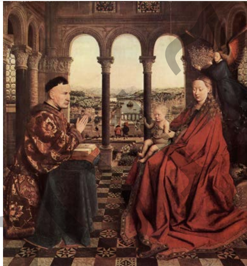
Rolin Kantzilerraren Ama Birjina Jan Van Eyck . La Virgen del Canciller Rolin

Analiza estas 2 imágenes (2,5 puntos cada una):