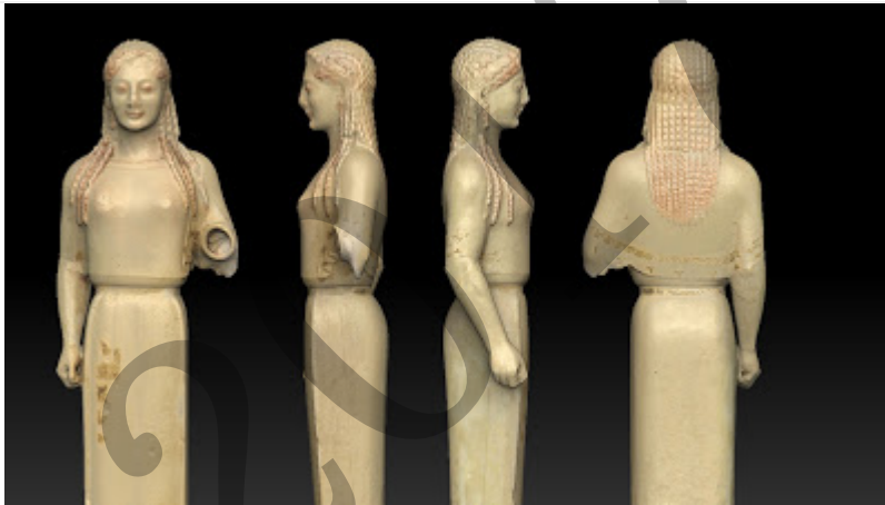
Kore peploduna / Kore del Peplo

Analiza estas 2 imágenes (2,5 puntos cada una):