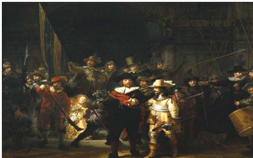
Gaueko erronda / Rembrandt / La ronda nocturna.