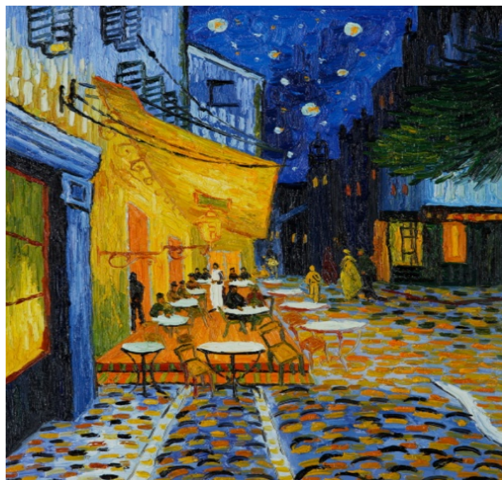
Kafetegiko terraza gauetz (Arles) / Van Gogh / Terraza del café por la noche (Arles)