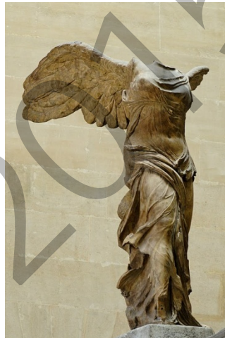
Samotraziako Garaipena / Victoria de Samotracia

Analiza estas 2 imágenes (2,5 puntos cada una).