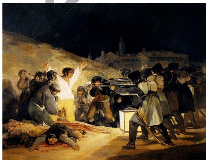
1808ko maiatzaren 3ko fusilatzeak Goya Los fusilamientos del 3 de mayo de 1808