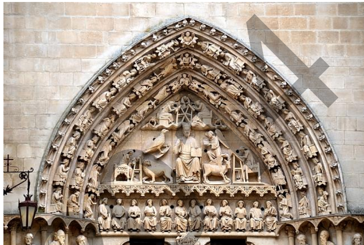
Burgosko katedrala: Sarmental ataria / Puerta del Sarmental de la Catedral de Burgos

Analiza estas 2 imágenes (2,5 puntos cada una).