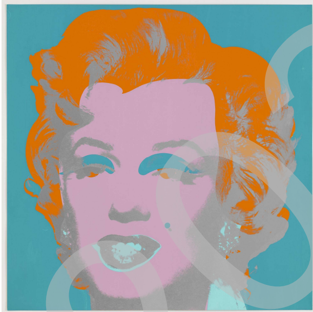
WARHOL: Marlyn , 1967, serigrafía