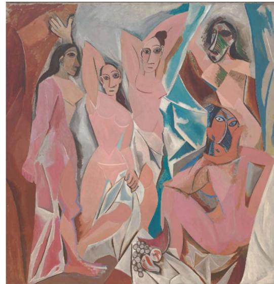
PICASSO: Las Señoritas de Avignon , 1907 (dcha.)