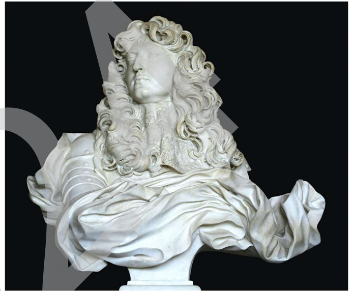
BERNINI: Retrato de Luis XIV, 1665