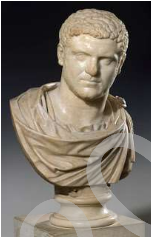
Retrato de Caracalla, siglo III