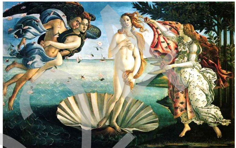
El nacimiento de Venus