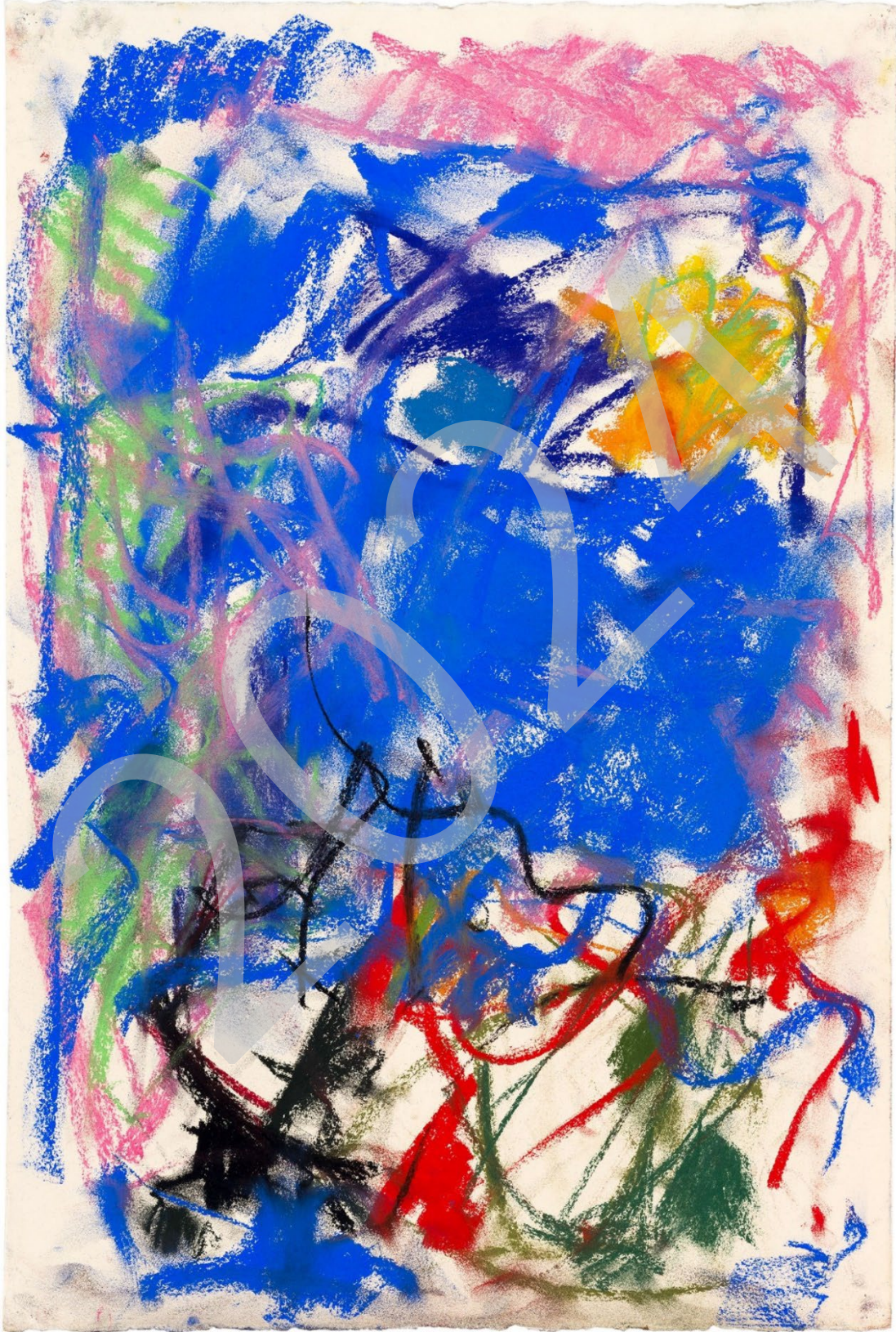
Sin título (1989). Joan Mitchell. Pastel sobre papel. 58.2 x 39 cm

TÉCNICAS DE EXPRESIÓN GRÁFICO- PLÁSTICAS