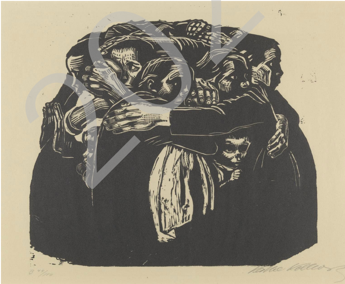
The mother's (1921). Käthe Kollwitz. Xilografía. 39 x 48 cm