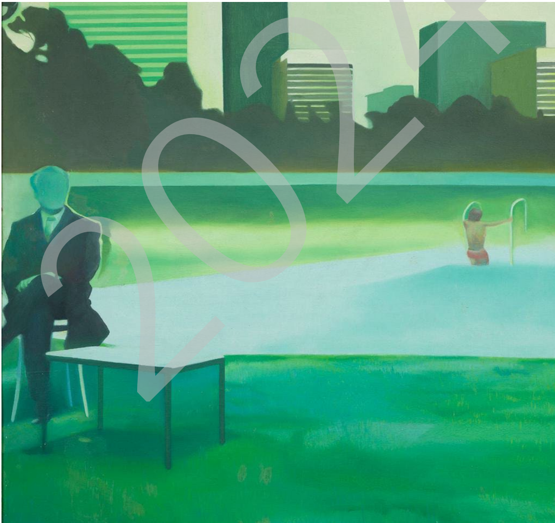
Sin título (1971). Isabel Baquedano. Óleo sobre lienzo. 100 x 100 cm

1. Compara ambas imágenes, analizando los aspectos formales y técnicos de las obras, comparando los procedimientos y materiales empleados en su ejecución: trazos, matices, claroscuros, relieves, color, composición, formatos, matrices. Para realizar la comparativa, es necesario utilizar nomenclatura y terminología del campo gráfico y plástico, para describir recursos, procedimientos y materiales. (Tiempo estimado: 20 min)